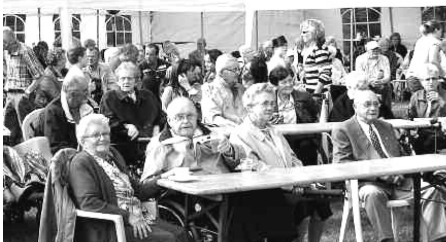
Op zaterdagmiddag was het feest voor de ouderen.