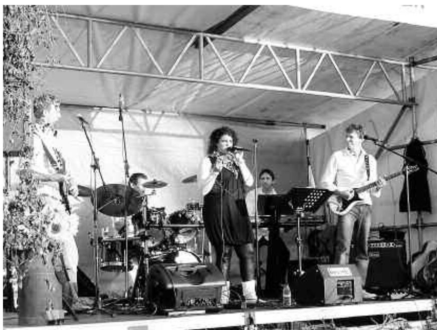
Brevis debuteerde sterk op het Hopoogstfeest